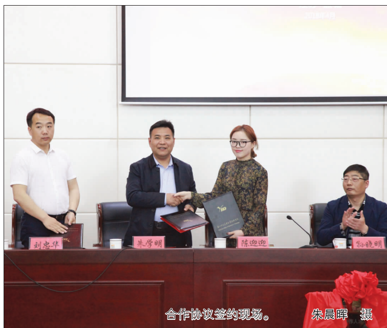
合作协议签约现场。