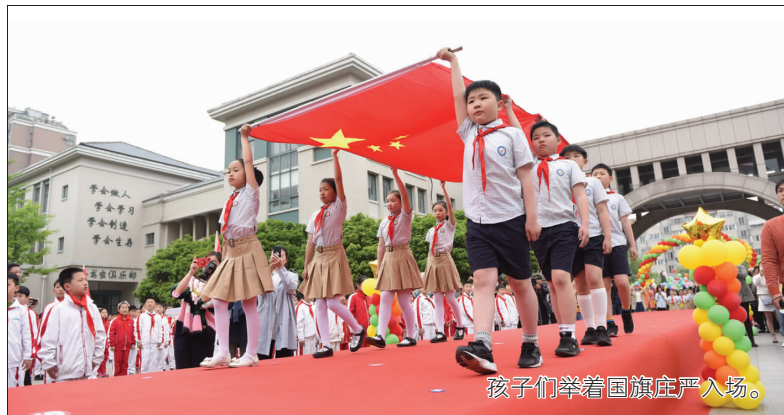
孩子们举着国旗庄严入场。