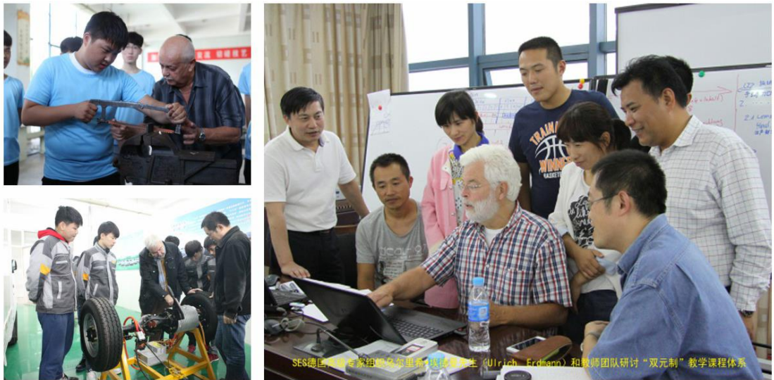
图10 德国SES高级专家组织专家来校指导双元制项目

型工厂’培训+企业顶岗实习”交互进行的教学模式，学生的实训课程占整个学时的60%以上，使学生具有优质动手实践的能力。我校与德国工商大会上海办事处的德国双元制教育合作深入开展，先后邀请三位德国专家来校现场指导，共同推进项目实施。目前2015、2016级学员顺利完成AHK毕业考试第一部分的考试，现已进入定岗实习阶段，被盐城森风集团和南京伟舜机械有限公司等单位整体预录。