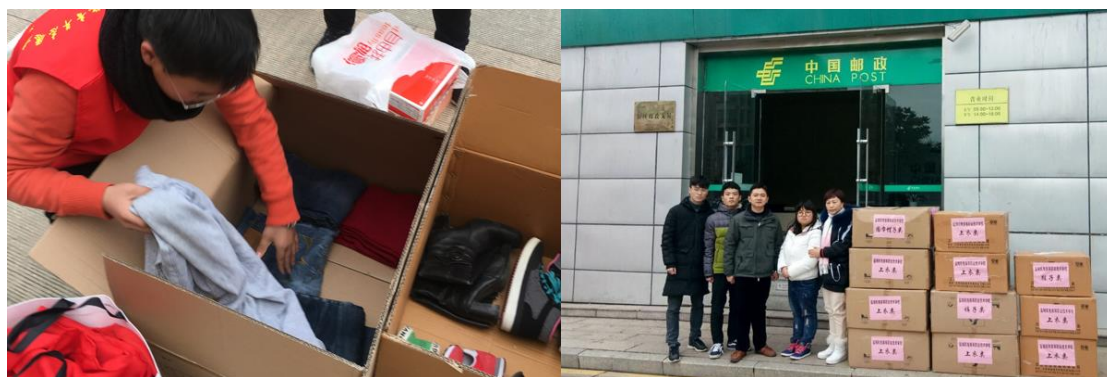
图 15 “衣旧情深，爱心捐衣”活动

校团委以育人为根本目标，不断深化对青年学生的思想引领和成长服务两大战略引领，狠抓基层组织建设和基层工作，切实加强团干部队伍建设，共青团工作实现了新发展，本年度 1 名老师被表彰为盐城市青年岗位能手，1 名老师被授予“盐城市优秀共青团干部”称号，1 名老师被授予盐城市教育系统“新长征突击手”称号，1 个班级被评为“盐城市五四红旗团支部”。