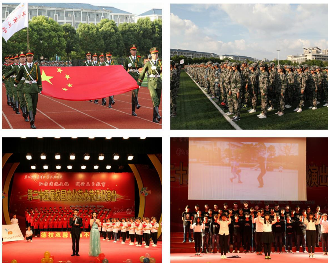
图16 “五自”教育亮点纷呈

活动和载体让同学们“自信、自强、自立、自尊、自爱”。近几年来，学生综合素质不断提升。