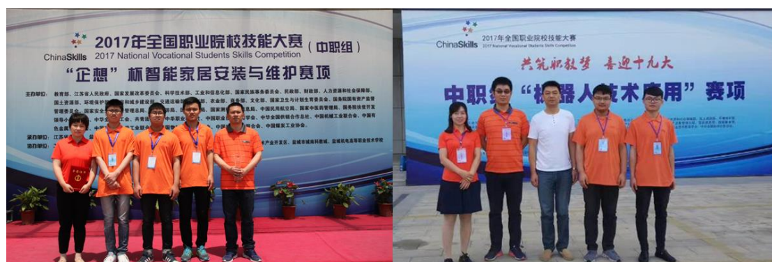
图5 2017年全国职业院校技能大赛金牌选手

职业院校技能大赛中，我校选手喜获中职组“智能家居安装与调试”、“机器人技术应用”两个项目的金牌和“网络组建与应用”项目的银牌。在省职业学校技能大赛中，我校取得6金13银16铜的优异成绩，获得江苏省职业院校技能大赛团体优胜奖，继续保持全省前列、全市领先的位置。2017年我校荣获第16届盐城市青少年科技创新大赛一等奖2项，二等奖1项，荣获第28届江苏省青少年科技创新大赛二等奖2项，三等奖1项，学校荣获第16届盐城市青少年科技创新大赛优秀组织奖。