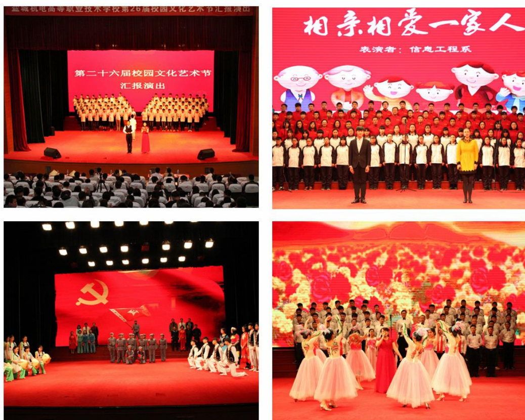
图4 校园文化艺术节

学校在原有的新烁吉他社、爱之声合唱团等六大社团外，又成立了具有地方特色的淮剧演唱剧团、剪纸爱好者之家等两个社团，各系部拥有心绘绘画社团、朝阳摄影社等30多个社团和8个体育运动团体。丰富多彩的社团活动，丰富了学生的课余生活，也提升了他们的综合素质和整体能力。