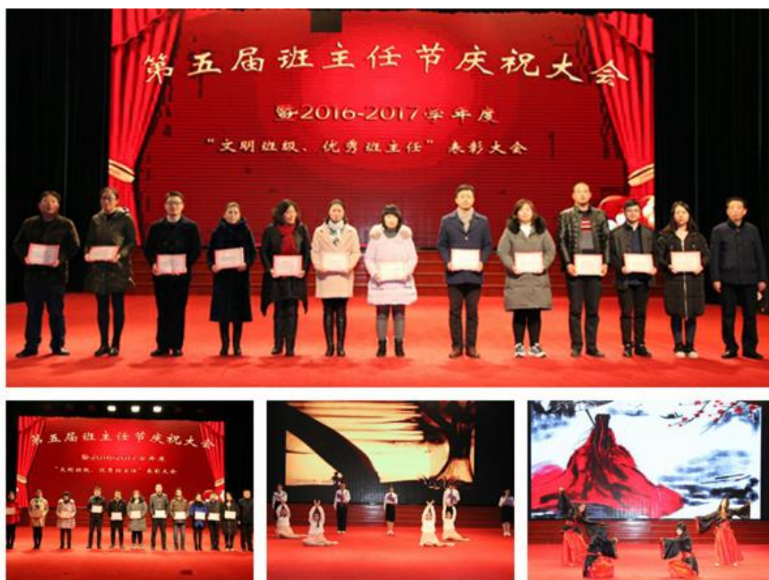
图18 第五届班主任节