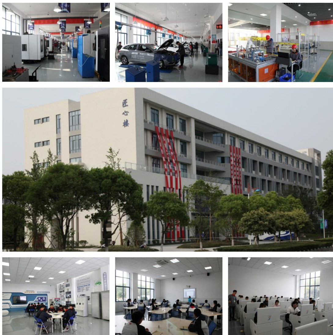
图11 江苏省职业教育高水平示范性实训基地