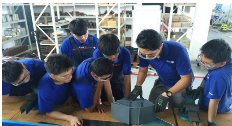
图13 中德班学生赴苏州德资企业进行定岗实习

学校严格按照《学生工学结合、顶岗实习管理规定》、《校外实训基地管理制度》等文件要求，对学生实习及管理工作进行了跟踪服务，各系部严格按照学校各项管理制度，有计划、有步骤地实施学生的各项实习安排及管理工作，实习效果明显，成绩突出，一方面实习单位对学生实习效果的反映普遍良好，另一方面学生的综合素质也得到提高。通过实习，同学们更真实、更深入、更全面地了解了企业，发现和学习基础工匠最本质、最优秀的一面，同时还获得一定的劳动所得和企业的充分肯定，建立起了学生职业自信和荣誉感。