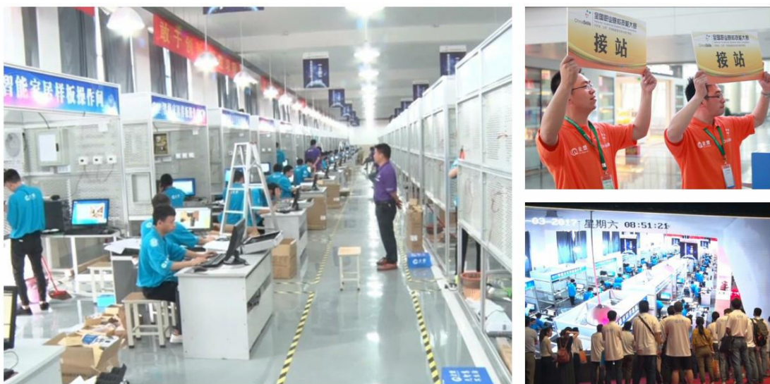
图6 2017年全国职业院校技能大赛智能家居安装与维护赛项

直辖市和计划单列市的96个代表队，近千名选手、领队和教练。我校精心筹备、细心谋划，井然有序、细致周到的服务工作获得参赛人员的一致好评，展现了优质的服务水平和良好的办学实力。通过技能竞赛平台，我校逐步形成了一套较为科学、系统的综合技能人才选拔、培训、管理、保障制度体系，有力的推动了学校教育教学水平提升。